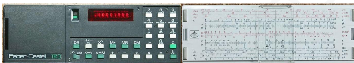
Fig. 1: Voor- en achterkant van het F-C TR3 hybride model

De hybride TR series van Faber-Castell (F-C), met de combinatie van een elektronische rekenmachine en een rekenliniaal, zijn apart. Geproduceerd in slechts een beperkte oplage tussen 1972-1977 deze series was een onlogische laatste poging van F-C om hun rekenliniaal business te handhaven 1 . F-C had echter de benodigde elektronische expertise voor het bouwen van een rekenmachine niet in huis, zodat de geïntegreerde schakeling, de oplader en zelfs de oplaadbaar nikkel-cadmium-batterijen bij andere bedrijven moesten worden ingekocht.