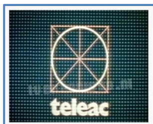
Figuur 3: Het beeldmerk van Teleac

Gelukkig kan ik iets meer over zijn internationaal erkende musicaluitvinding vertellen. In 1956 werd een auteursrecht met nummer 308/1429 voor "The Egg of Co" aan Kornelis Piet Hendrik Jasperse verleend. Vier jaar later kreeg hij nog een Amerikaans auteursrecht, met nummer 17284, voor hetzelfde muzikale schuifkaart. In de volgende decennia nam de vraag naar de akkoordenschuifkaart niet af. In 1984 bijvoorbeeld, zond de Nederlandse Omroep in samenwerking met TELEAC 1 een "Lets Swing" cursus uit om jazz te leren spelen. Het Ei van Co was een onderdeel van de